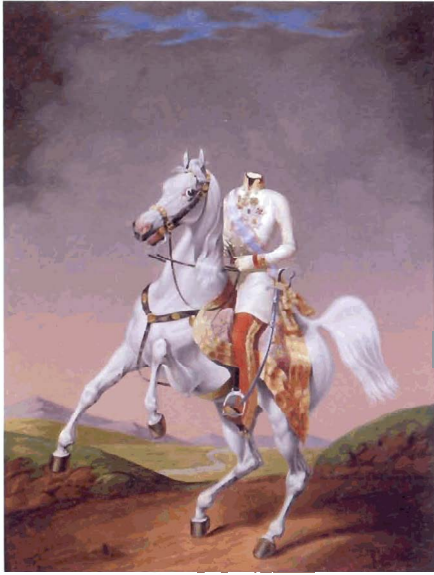
Nicht kopflos in ein Ereignis

Schnell steht man in einer Krise kopflos da. Da hilft ein Notfall- und Kontinuitätsmanagementsystem. Vorbereitet sein bewirkt, dass Notfälle und Betriebsstörungen einen kleineren Einfluss haben und dass auch der Normalbetrieb schneller wieder hergestellt werden kann. Ein Business Continuity Management (BCM) hilft auch dem Sicherheitsbeauftragten (SiBe) auf verschiedene Weise. Das BCM will ich im Folgenden entlang der Norm SN EN ISO 22301 diskutieren. Die Norm ist systematisch wie andere Managementnormen aufgebaut und folgt dadurch auch dem Zyklus von Planen – Ausprobieren – Überprüfen – Verbessern (plan do check act). Es kann darum gehen ein BCM formell aufzustellen. Es kann aber auch ein Leitfaden sein, um sich erst einmal mit dem Thema BCM orientierend auseinander zu setzen.